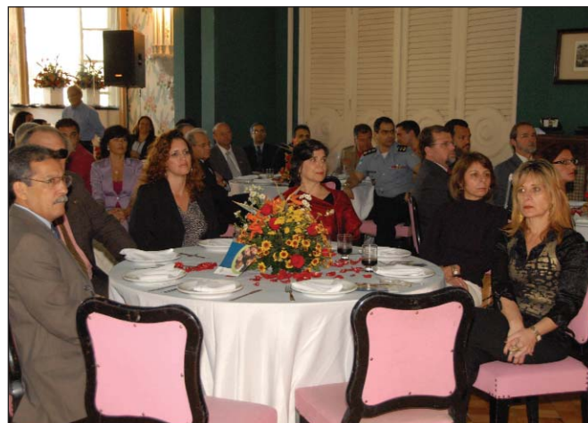
Evento no Palácio Quitandinha, em Petrópolis