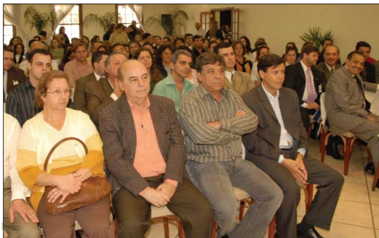
Lançamento em Friburgo

Agora, o Educar Para Proteger começa a ser aplicado nas escolas da região serrana. A expectativa é que sejam realizadas oficinas em 55 escolas, para mais de 7 mil alunos. A iniciativa, uma parceria do Sindicato das Seguradoras do RJ/ES com o Sindicato dos Corretores de Seguros do RJ, continua a ser realizada em Volta Redonda e cidades vizinhas, onde já foram contemplados 2.059 alunos com 61 oficinas pedagógicas em 14 escolas.