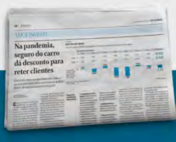
+ O Globo