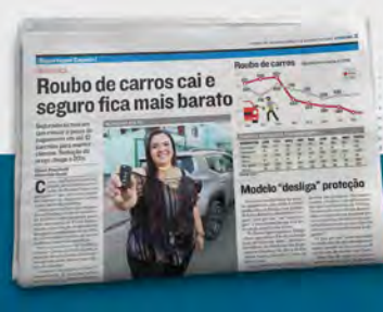
+ Tribuna ES